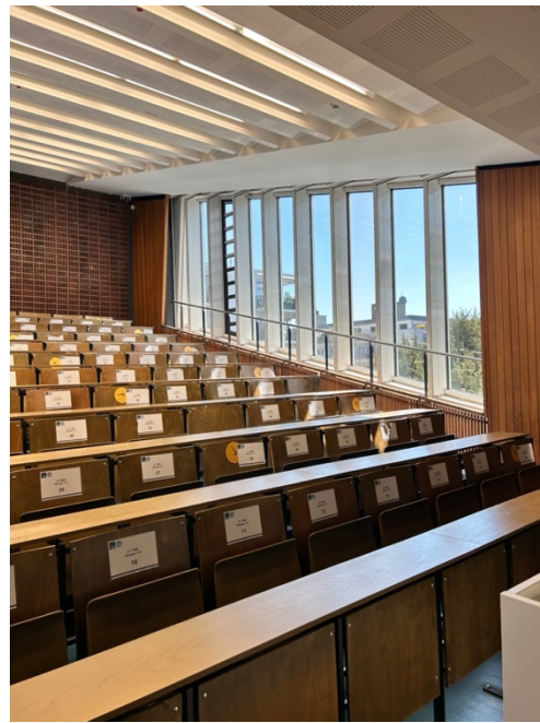
左圖：Main building 的 Bistro ( 賣簡單輕食和甜食居多 )；右圖：講堂教室