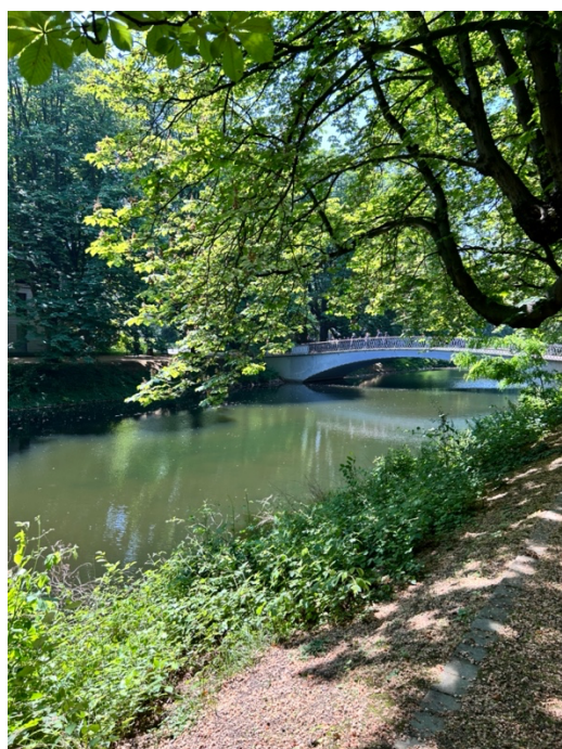
🚩左圖：科隆大學大草坪；右圖：靠近人文科學大樓的 Clarenbachkanal