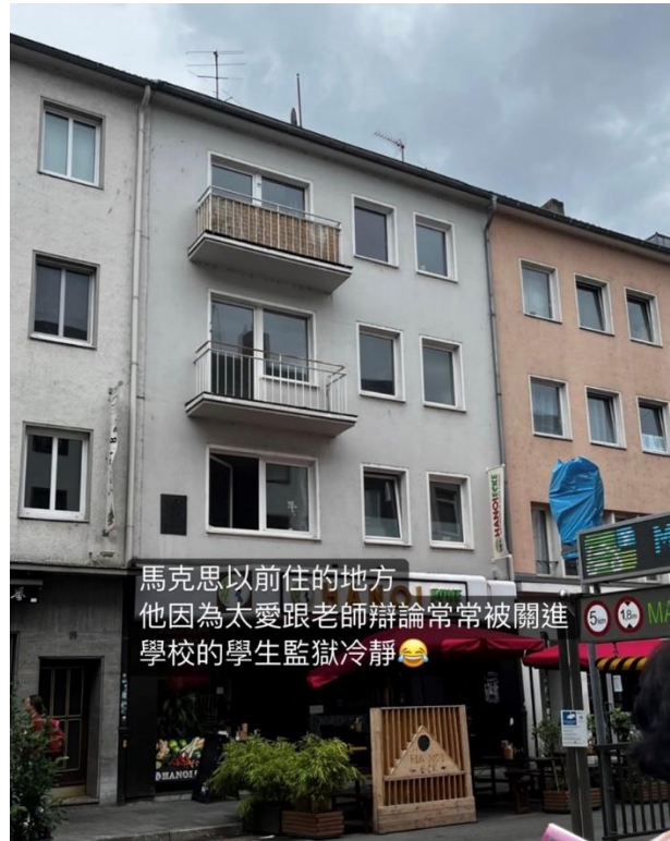
馬克思以前住的地方 他因為太愛跟老師辯論常常被關進 學校的學生監獄冷靜😂