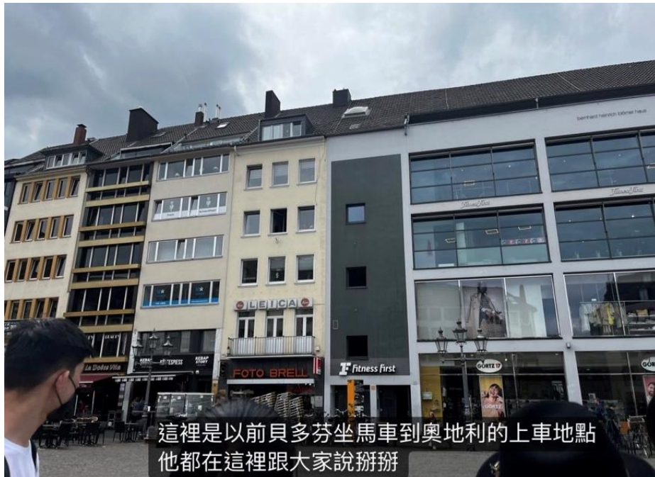
這裡是以前貝多芬坐馬車到奧地的上車地點 他都在這裡跟大家說掰掰