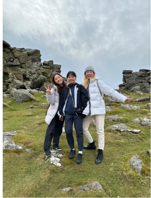
← Dartmoor National Park 校外教學