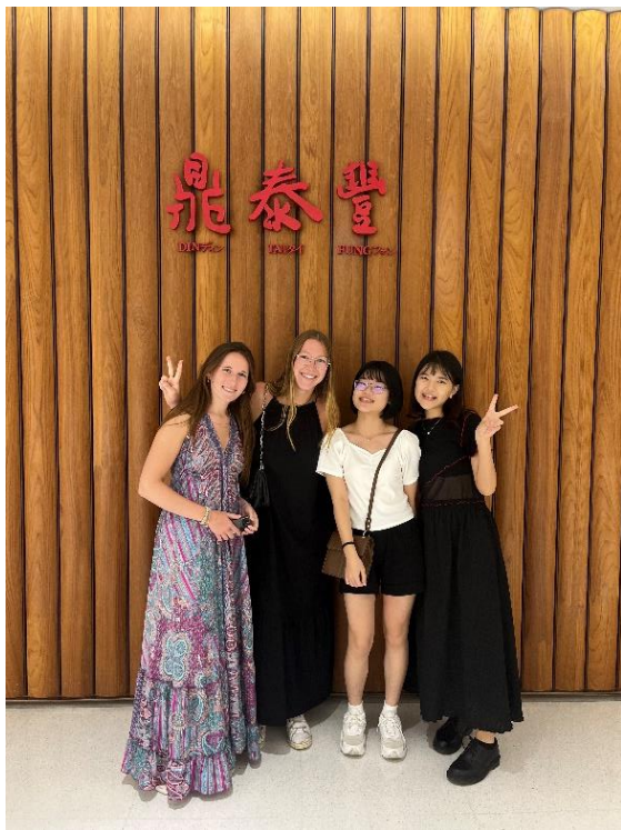
跟系上同學一起與buddy吃晚餐