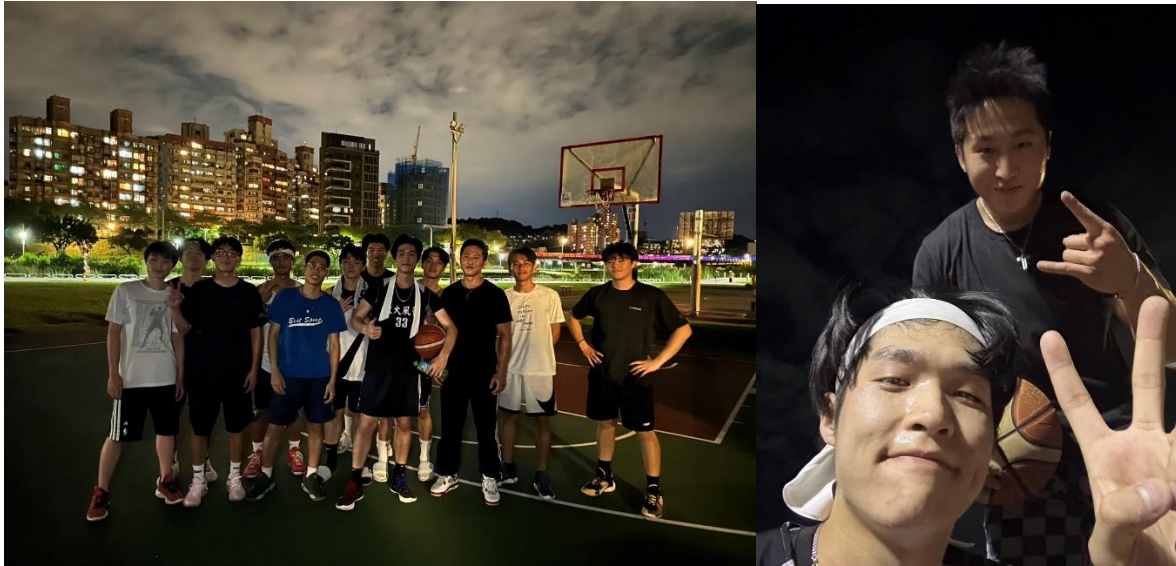
照片*2 (含文字介紹、拍攝日期及地點活動名稱)