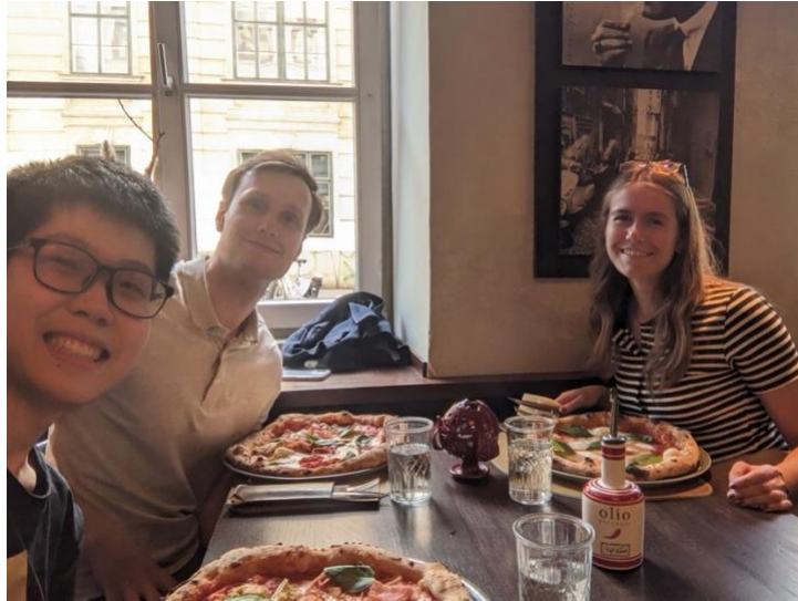
圖 1： Cross-Cultural Competence 課程結束的聚餐