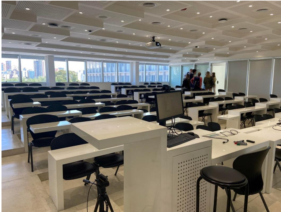
圖二、Di Tella 教室圖

校方對交換學生十分照顧，常舉辦像是相見歡、城市一日遊、披薩聚會、期末歡送等活動，讓我們有機會認識彼此，而在學期前所有學生都會被加入到 WhatsApp 群組，於是一到阿根廷我便去了幾個同學們在群組邀約的晚餐，喝幾杯啤酒之後大家都熟了！而因學校提供全英文的課程，因此即便我的西文能力還不夠好，我也能修習全英課程，體驗與來自不同國家的學生共同修課的感覺，當然如果會說西文的同學可以有更多的課程選擇，也是一個增進西文能力絕佳的方式。