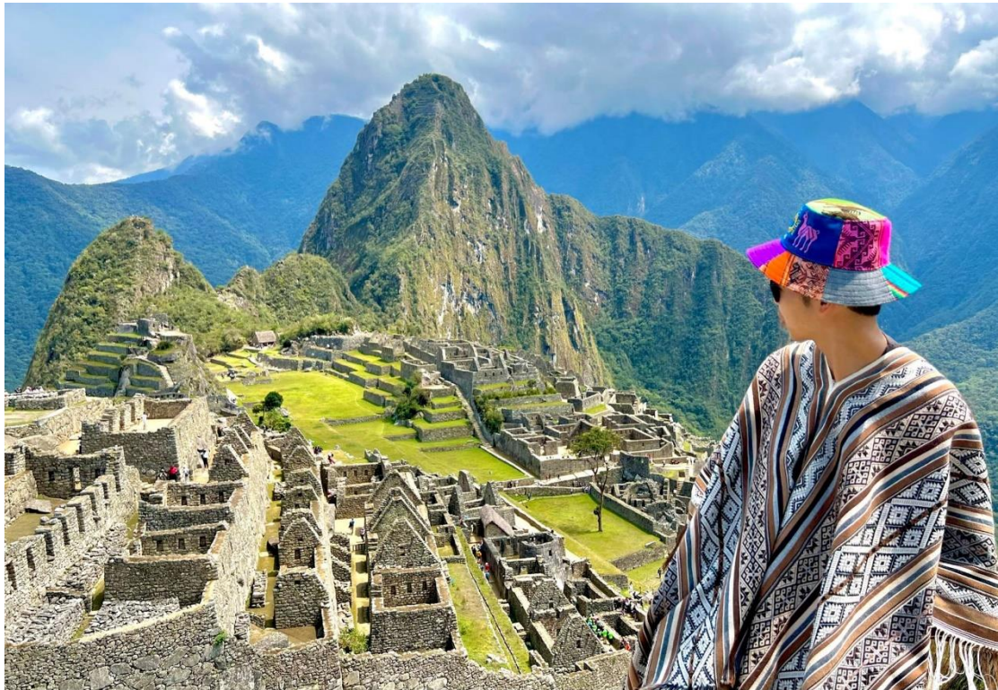
圖五、祕魯馬丘比丘合照

而南美洲的旅遊景點更是不必多言，在交換期間我去了祕魯看世界七大奇景馬丘比丘，也去了世界三大瀑布之一的伊瓜蘇瀑布，和到阿根廷南方看了冰河、世界最南端城市烏蘇懷雅等等眾多地方，我認為在南美洲能夠到達的景觀與文化絕對不亞於世上任何國家，看到這些不可思議的景色，將很慶幸當初自己選擇來到南美洲交換，親自目睹世上有這樣的美麗大陸存在。