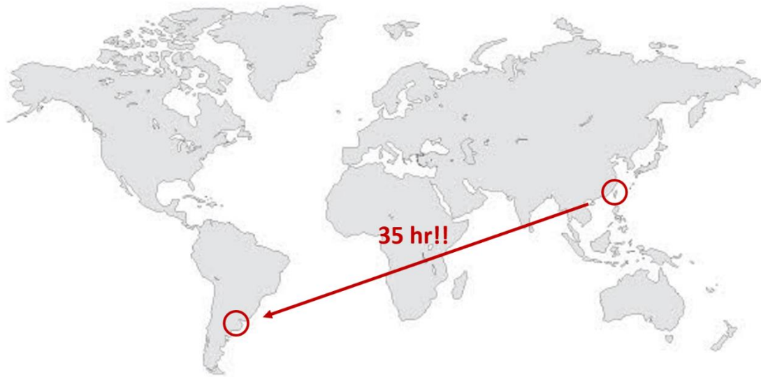
圖一、飛行 35 小時的地球彼端 - 南美洲阿根廷