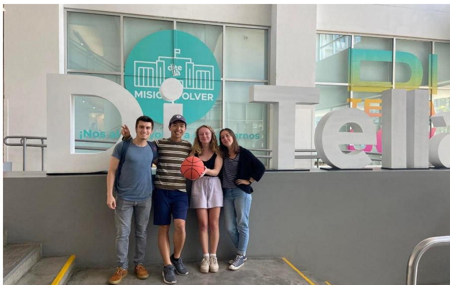
圖三、與組員期末報告後合照，並順道去打籃球