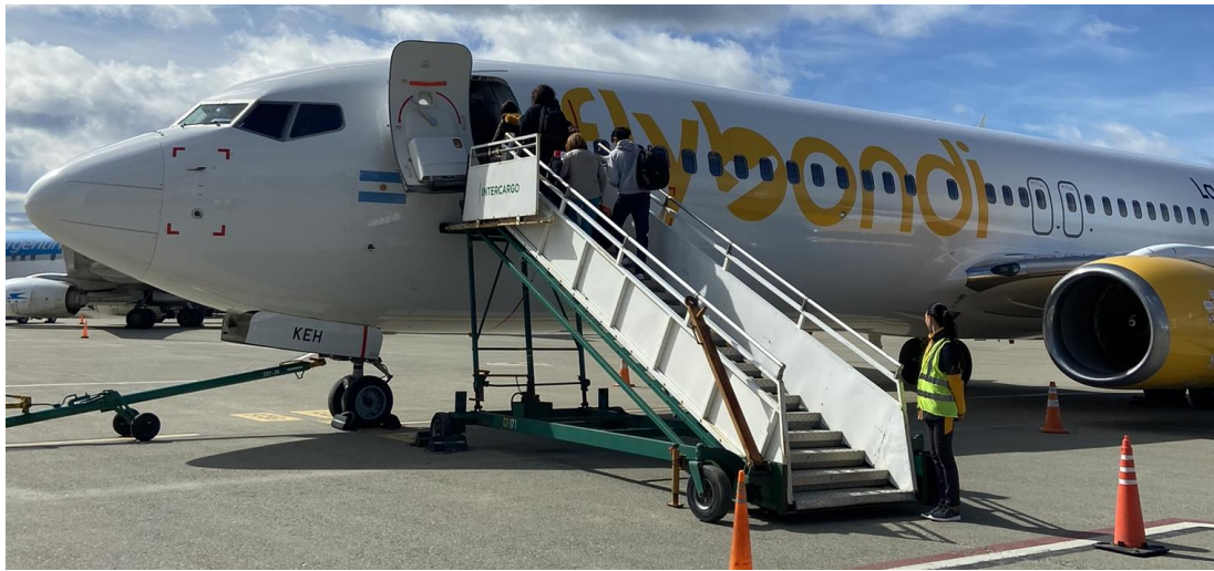
圖五、國內廉航 Flybondi 圖

如果要去其他城市，可以搭飛機或巴士，但巴士可能都要坐 20 小時以上，我坐過一次雖然椅子很躺、也很舒服，但真的是要坐太久… 建議可以買當地廉價航空的 Flybondi 年票，有五次來回國內城市的機票，總共只要 8000 台幣，等於若是飛到最南端世界盡頭的烏蘇懷雅看企鵝，3 個半小時飛機來回也才 1600 台幣，對沒有太多時間限制的交換生而言非常適合。