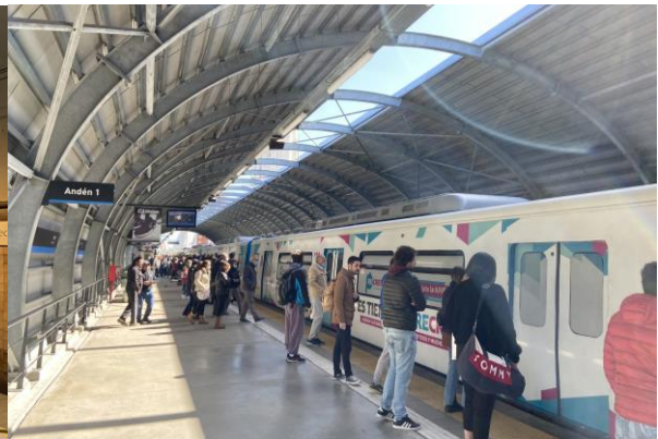
圖四、阿根廷火車站