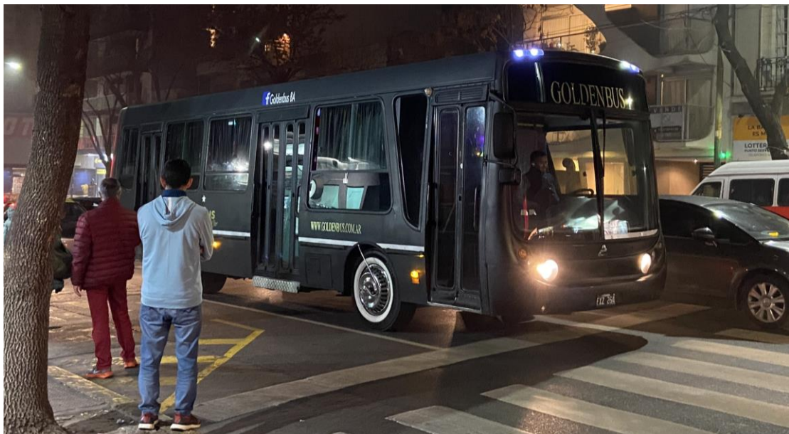
圖二、夜晚充滿電音的公車

我覺得到國外就是要勇於去認識新朋友，第一次這樣的聚會非常重要，因為我後來發現大家都是跟一開始就熟的人繼續聯繫，其他人要認識的機會就相對少了很多，所以總結來說，不用害怕自己去認識外國朋友，他們都很願意去認識唯一來自亞洲的人，並且我也因此在國外都只會跟外國人相處，學習到他國文化的思維，而轉而反思過去我在的生活方式，異國文化的衝擊確實對我的生觀帶來很大的改變。