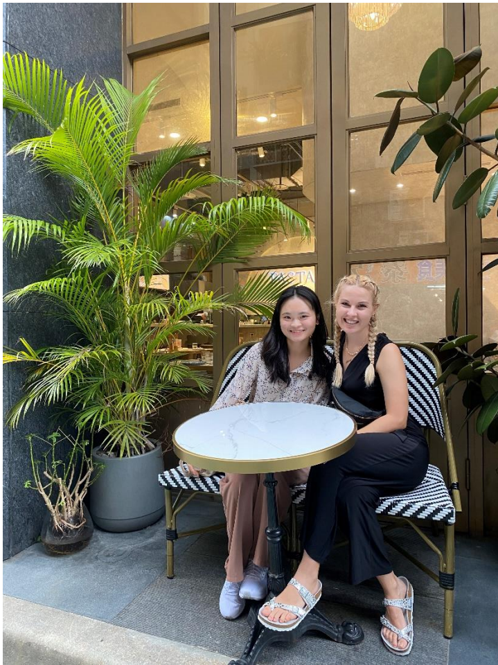
照片*2 (含文字介紹、拍攝日期及地點活動名稱)