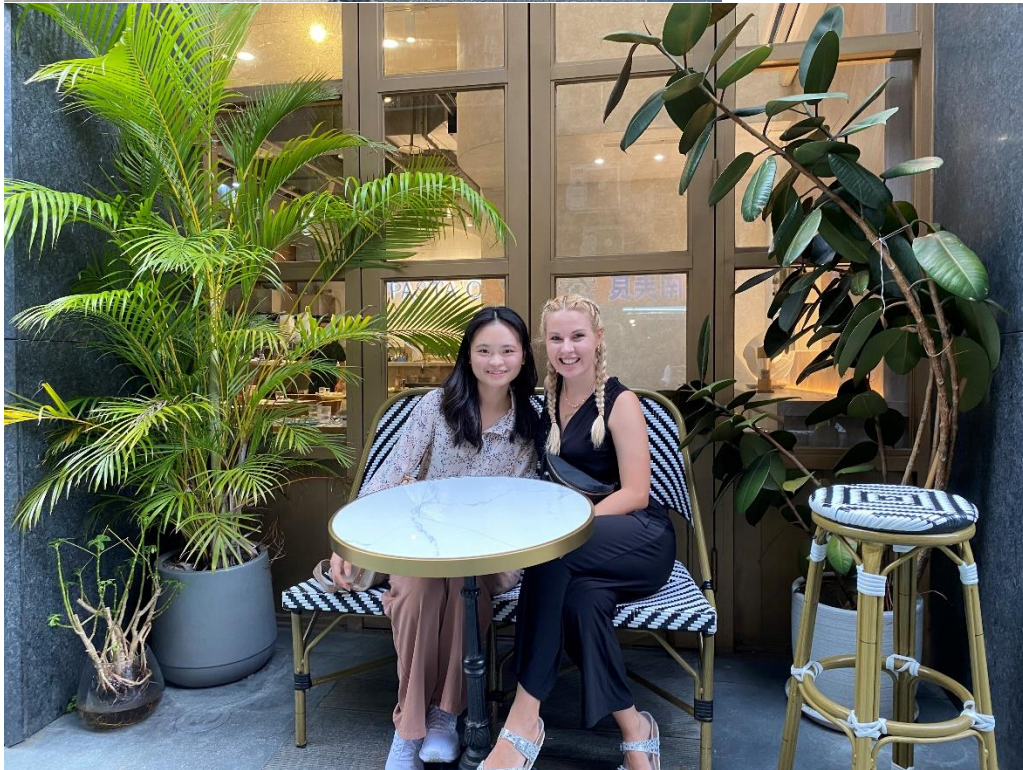
2023. 9. 20. 於大安區義大利麵餐廳 Pastaio 第一次見面