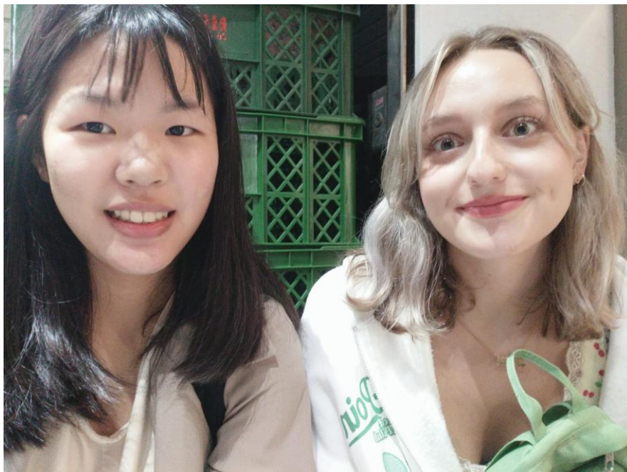
照片*2 (含文字介紹、拍攝日期及地點活動名稱)