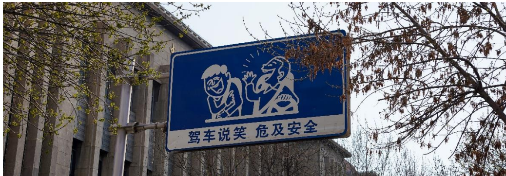
圖：天津人蠻幽默的 可以在當地聽相聲