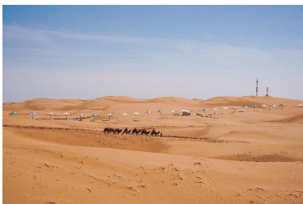
圖：響沙灣/ 希拉穆仁草原

趁著五一假期去了一趟內蒙古，之前還沒想過有一天會走進草原、沙漠、高原、火山地帶。整趟旅行體驗了很多，感受到了多變的天氣，也看到了一整片的星星，幸好都遇上了不錯的天氣，才有了這特別的體驗。