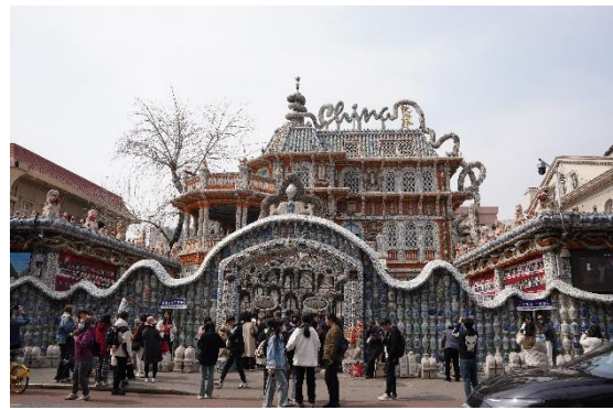
圖：瓷房子 (北大學生證能免費進去)