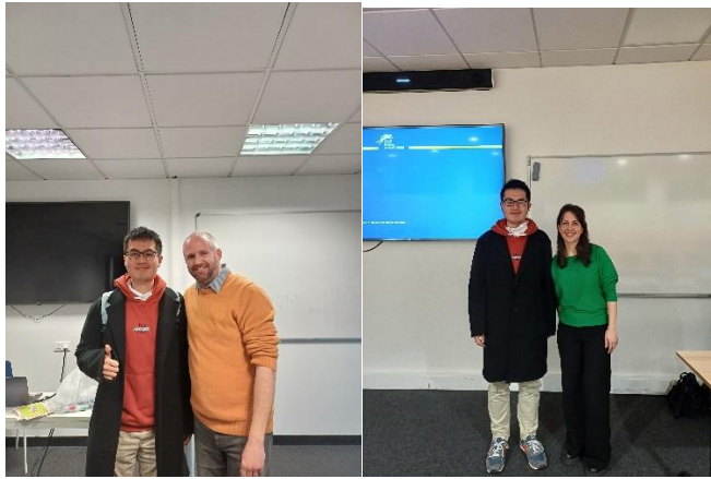
我與其中 2 位老師的合照