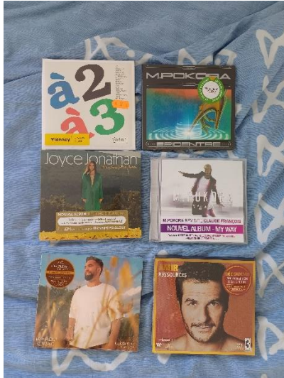
我在雷恩買的 6 張法文歌專輯