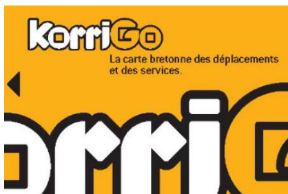
雷恩 KorriGo 票卡示意圖