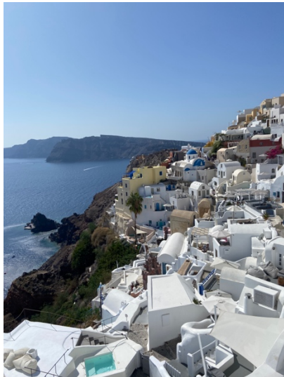
伊亞 Oia 藍白小鎮

我和朋友抓住夏天的尾巴，在 10 月去了一趟希臘，除了在雅典參觀神廟古蹟外，還規劃了三天兩夜在聖托里尼島的旅遊，從雅典飛聖托里尼非常近，不到一小時就到了。10 月去已是旅遊旺季的尾聲，旅客雖然還是蠻多的，但不像 7、8、9 月那麼爆滿。我們是選擇住在伊亞 Oia 小鎮，就是在聖托里尼島最著名的藍白建築中，一晚雖然不便宜，但能有機會住在夢幻的藍白小鎮，開箱他們的傳統洞穴屋，享受海景第一排的美景，度假氛圍感拉好拉滿，還是非常值得的！去過一次一定會永生難忘，推薦給大家！