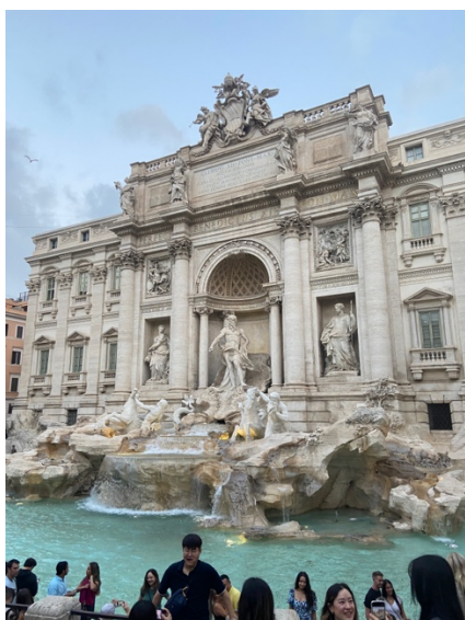
特雷維噴泉 / 羅馬許願池

具節，吸引來自世界各地的遊客前來參加。我去的時候是 1 月初，剛好是威尼斯旅遊的最淡季，沒什麼遊客、天氣也不太好，但仍然不減損這個城市的美，大家有機會去的話，不妨查查看面具節的開始日期（每年都不一樣），能參與到這個世界嘉年華盛會，一定也會是一個很難忘的體驗！義大利美食也很好吃，義大利麵、披薩不用多說，道地的提拉米蘇和 gelato 也請一定要嘗試，在義大利旅遊的每一天都被美食療癒到不行。