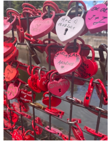
圖三、科爾馬愛情鎖