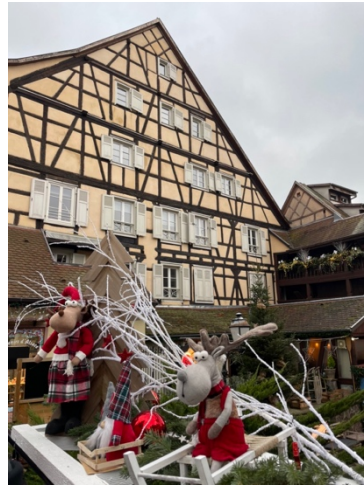
圖二、聖誕市集的科爾馬