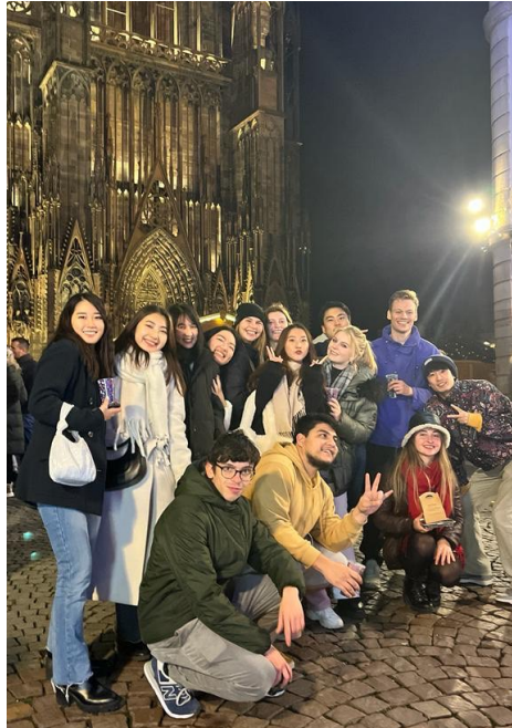
圖二、跟朋友們一起逛聖誕市集