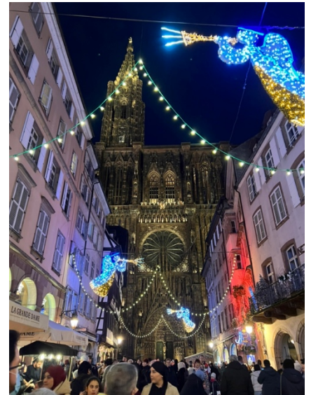
圖三、史堡大教堂聖誕市集