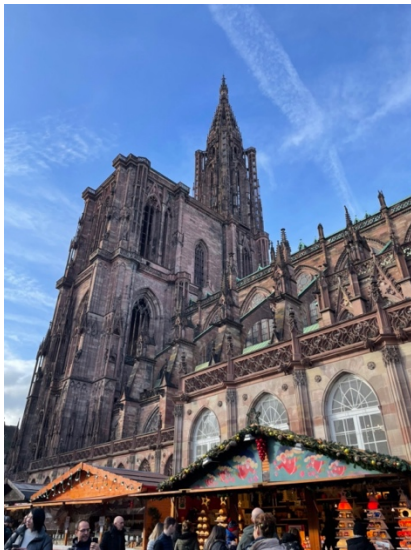
圖一、早晨的史堡大教堂