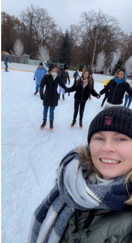
圖一、科爾馬體驗 ice skating