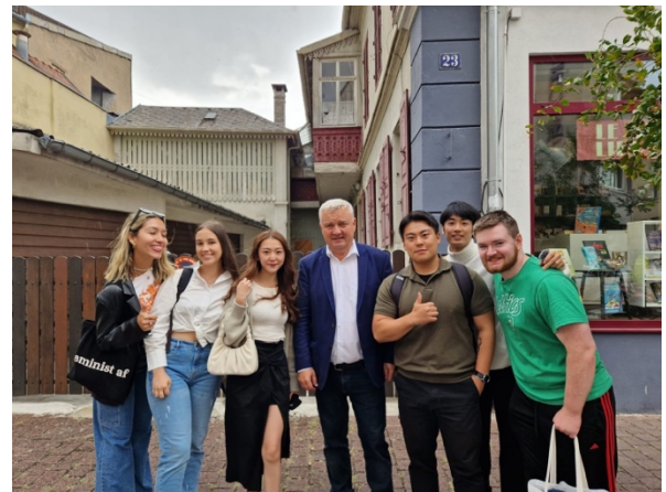
圖五六、巧遇科爾馬市長，意外受邀到市長辦公室！