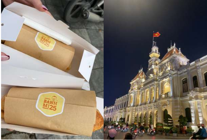
(越南 - 左：河內三明治 / 右：胡志明市)