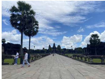
（柬埔寨 - 吳哥窟）

在 SASIN，每個學期結束之後會有 3-5 天的休息日，很多交換生們利用這個假期出國玩。因為泰國位於亞洲中心，去其他東南亞國家都會又近又便宜。我在 4 個月的交換期間，去了 5 個國家，包括柬埔寨、寮國、越南、中國大陸，以及新加坡。不過要出國時，一定要記得辦 Re-Entry Permit（再度入境許可），申請費用會是單次 1000 泰銖、多次 3800 泰銖，可以按照自己的需求與安排再申請合適的。可以在移民署或機場（BKK 或 DMK）都可以申請。