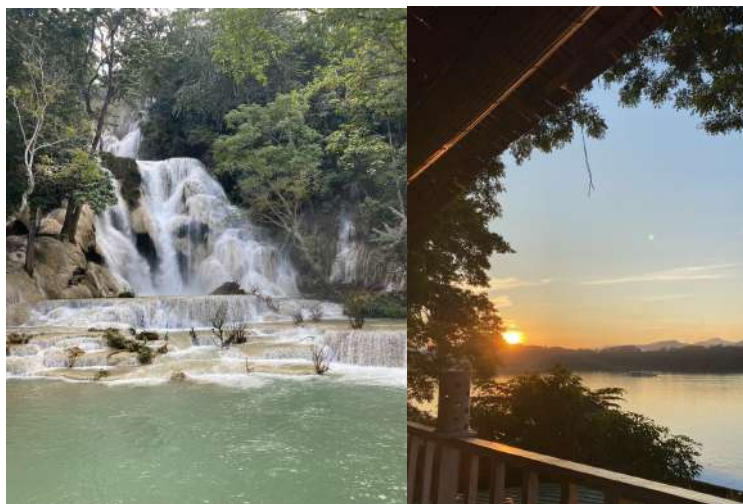
（寮國 - 左：關西瀑布 / 右：湄公河）