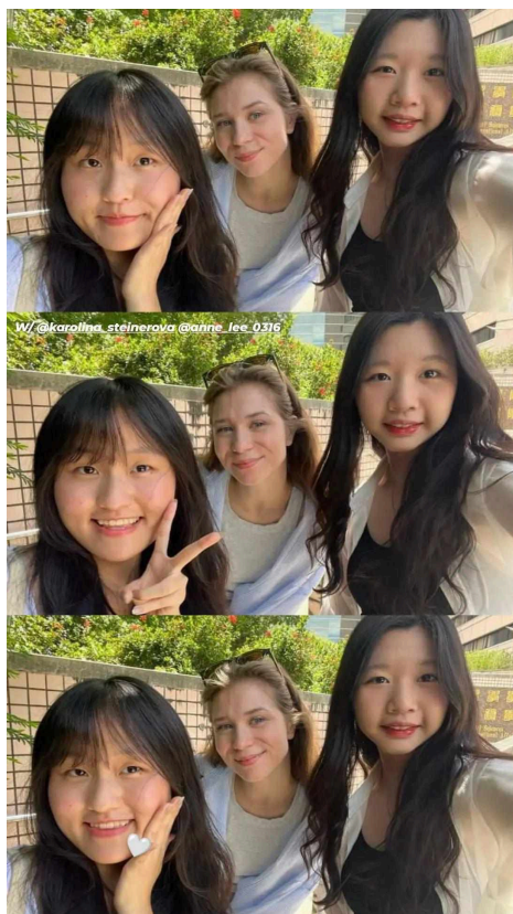
照片*2 (含文字介紹、拍攝日期及地點活動名稱)