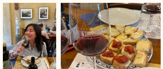
Florence Wine tasting tour