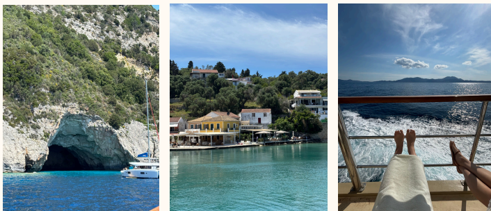
Paxos islands &amp; Blue caves tour