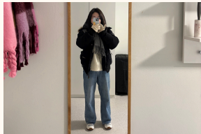
一二月每天都包得像一顆肉粽

衣的部分我覺得每個人差異蠻大的，像我就是不太在乎穿怎樣的人XD所以常常都是一件褲子穿五天（好噁）但我是覺得如果去很冷的地方（例如Tromso或冰島）我就會帶很多衛生衣（速乾排汗）去替換，外面那層就可以不用換，反正很冷的時候其實外套都穿著，拍照也看不到裡面穿什麼。