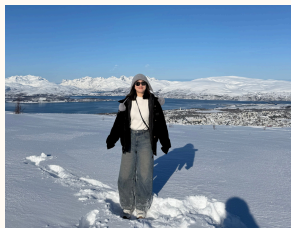
在Tromso我就是一件褲子穿五天

在吃東西的方面，我的經驗是「南歐外食，北歐自煮」！南歐的食物跟北歐比起來真的便宜又好吃，希臘的食物是我覺得最便宜的，大概跟台灣差不多，甚至超市裡的優格兩盒400克只要台幣30快不到！義大利大概就跟台北物價差不多，但通常都更好吃XD 所以我會推薦在南歐旅遊的時候可以多嘗試外食！（而且來都來了多試試當地料理真的不虧！）但是像在挪威冰島我就建議可以到超市買食材回Airbnb自煮，因為外食真的超！級！貴！一餐平均大概要8-900台幣，但在超市自己買食材就可以吃得飽也省很多錢，所以我在北歐旅行的話就都幾乎去超市買回來自己煮，推推！