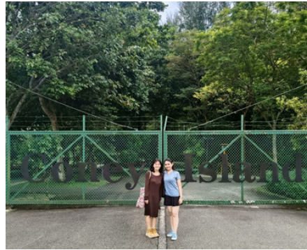
My buddy & I @ Coney Island

針對秋季班（8 月入學）的交換生，NUS 約於 6 月以電子郵件方式寄送 Global Buddy Program 的報名資訊至個人信箱，若有興趣建議務必把握機會報名參加。