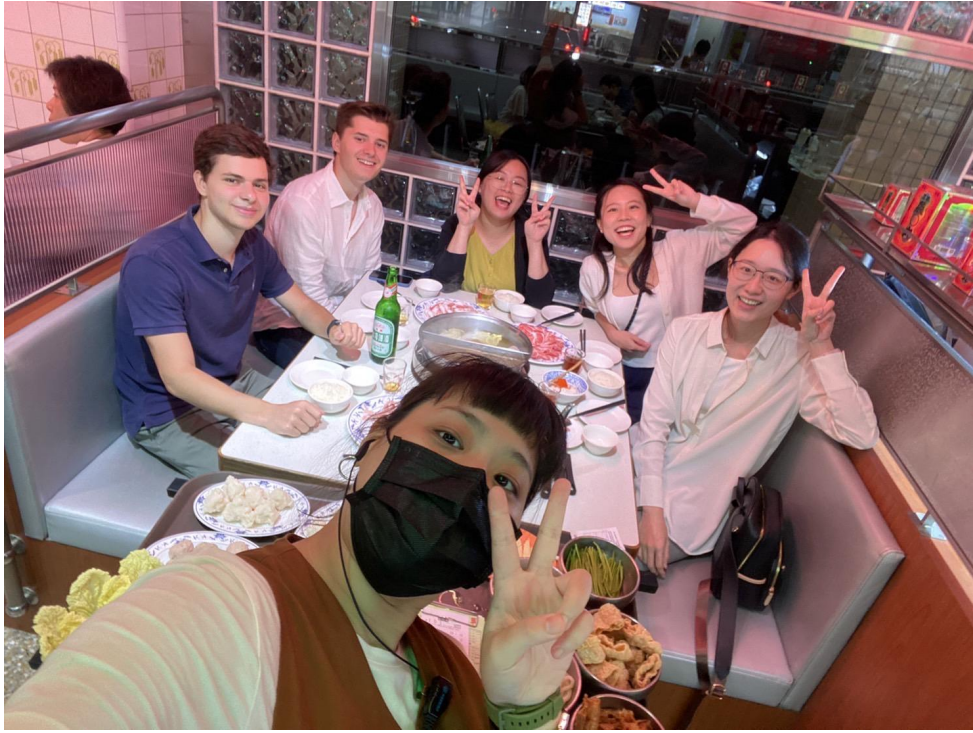
學友接待生活, 未完待續.....。