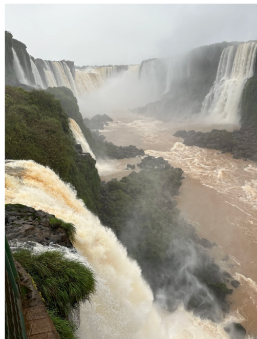
(上) 阿根廷側瀑布 (下) 巴西側瀑布