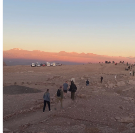
智利月亮谷Valle de la Luna