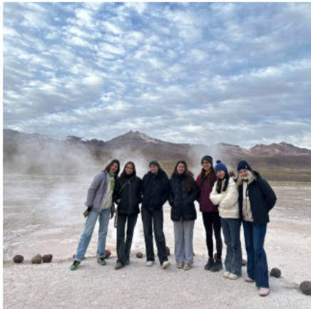
從玻利維亞要前往智利路上的地熱