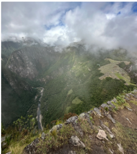
從Wayna Picchu俯瞰整個印加古城山頭