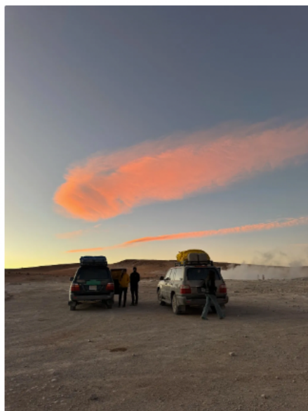
玻利維亞Uyuni三天兩夜的跟團