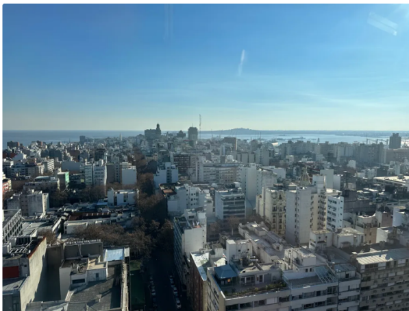
市景後方的遠山是首都montevideo命名由來之一

建議吃喝：Chivito 牛排漢堡，很像 Choripán 但裡面的豬肉換成牛排！