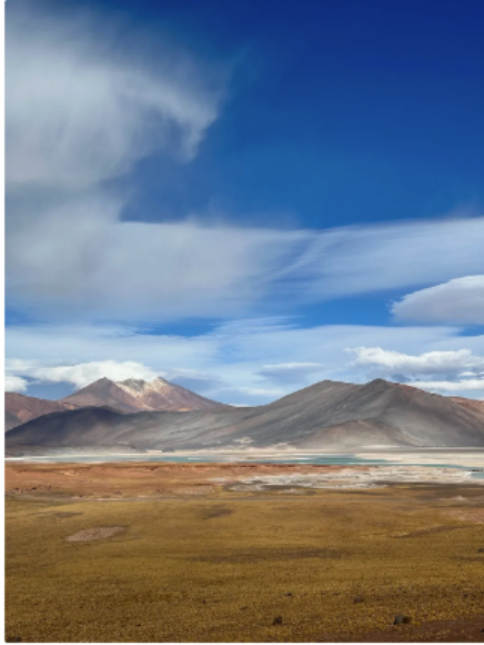
三國交界的兩座大聖山