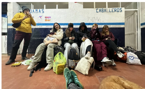
在阿根廷邊界等待前往玻利維亞的休息