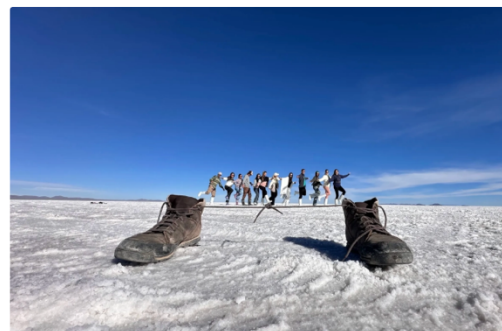
來到天空之鏡必拍的鹽湖照