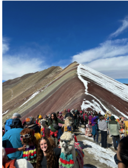
積雪版的秘魯的彩虹山 Vinicunca / Montaña de Siete Colores