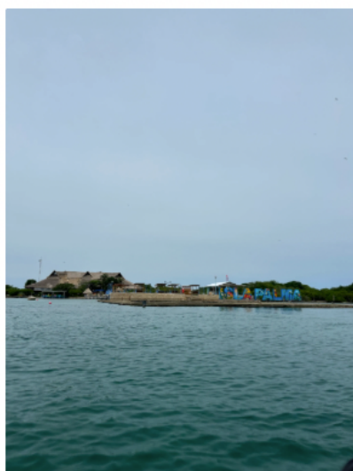
哥倫比亞北部靠海可以去附近小島