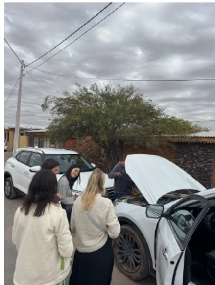
在智利租車拋錨遇到善心人士相救