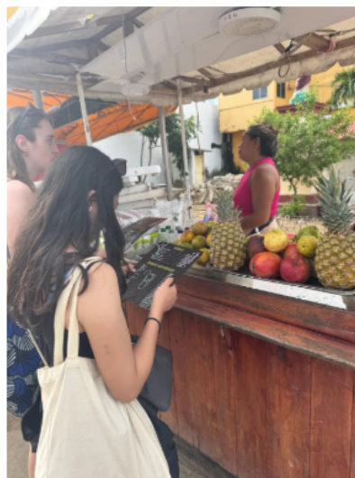
每天都在選不同果汁去嘗試