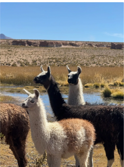
整趟旅程都會看到羊駝家族