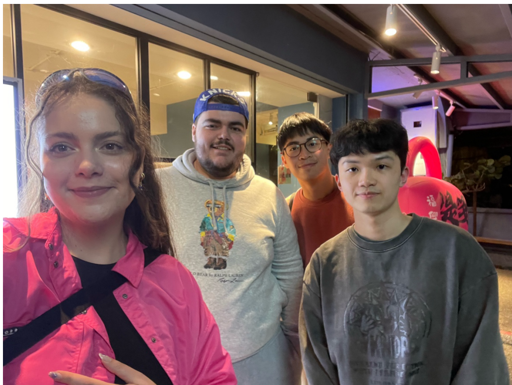
和學伴吃小尚品的合照

學伴一起聚餐。和朋友討論之後，我們選在小尚品火鍋店一起聚餐。我們和學伴有聊到台灣學校和法國學校教育上的差異，還有法國人的飲食文化，藉此更了解法國文化，也順便訓練英文口說。雖然有時候會因為還沒習慣口音，所以有時候會不了解學伴說什麼，不過還好學伴人非常好，會再解釋一次給我聽，和他聊天感覺是輕鬆的。我覺得和不同文化的人聊天可以聽到很多不一樣的觀點和故事，所以這次的接待經驗我覺得非常的有趣。