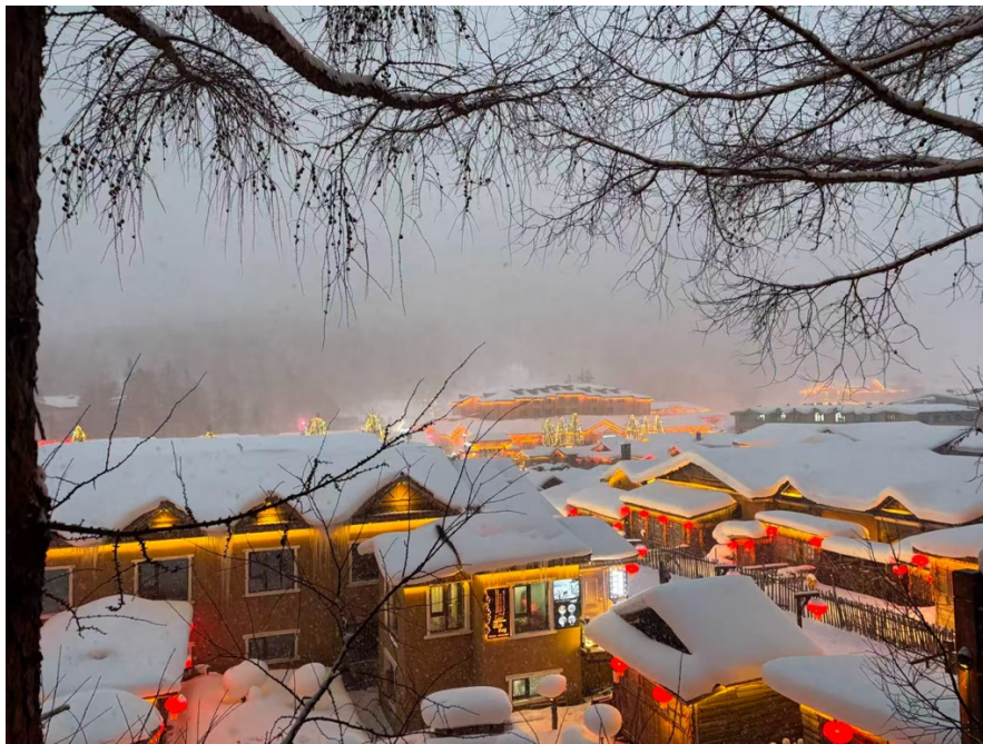
雪鄉（積雪很厚，看起來很可愛）