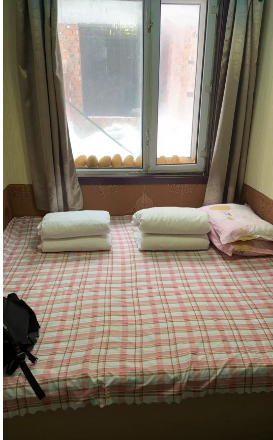
雪鄉的炕房民宿（以前只會在課本上看到）