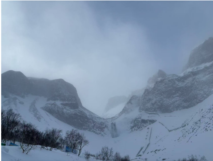
長白山（非常冷，下方有一個谷底森林，也很值得去）