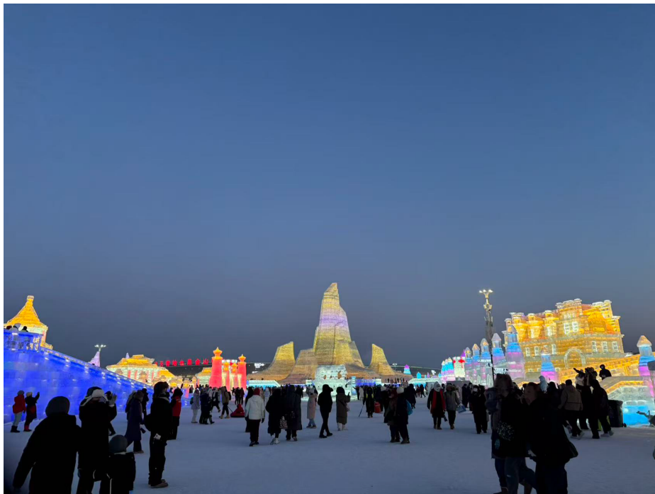
哈爾濱冰雪大世界（摩天輪跟超長溜滑梯必玩）