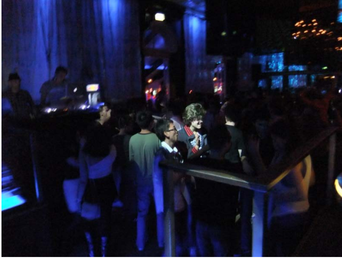
→Mid Week Party