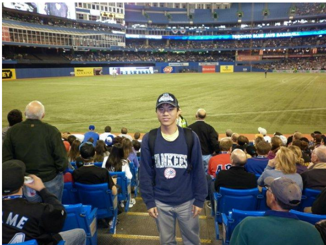
NYY vs. TOR