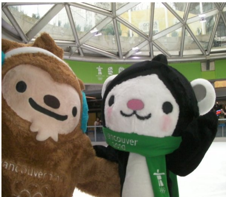
上面兩隻玩偶是奧運吉祥物。在溜冰場上表演

今年（2010）剛好輪到溫哥華辦冬季奧運，在開幕前一個月 downtown 就很有氣氛。隨處可見冬季奧運標誌、玩偶、擺設、各式商品和加拿大國旗飄揚。