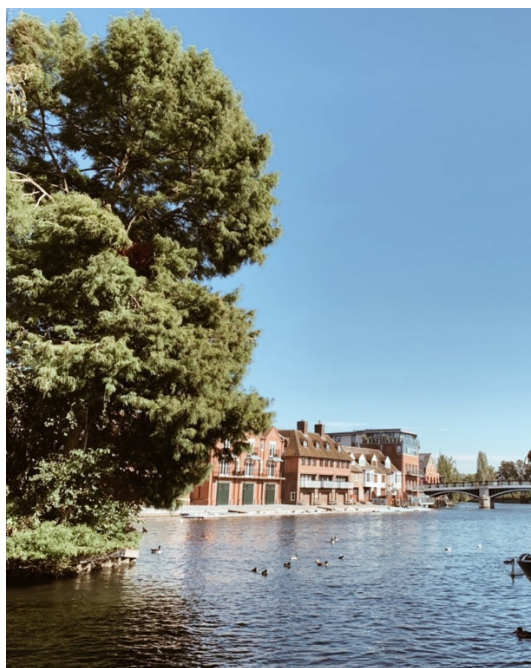
Tower Bridge& 溫莎小鎮風光。