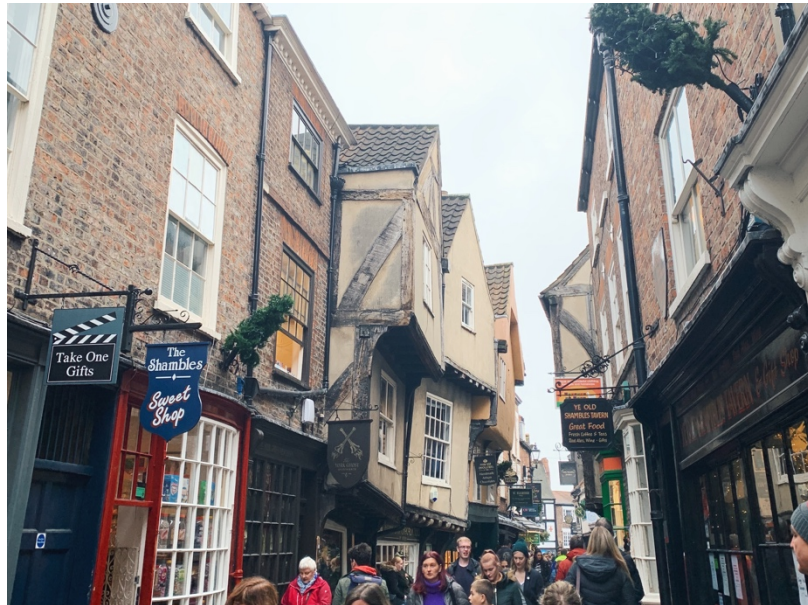
哈利波特的斜角巷。

約克真的很無聊，撇除斜角巷與各式鬧鬼古蹟等行程外，待到三天就真的太多了，不過約克郡內近郊的美麗小鎮倒是很多，像是濱海 Whitby 跟我這次去的 Knaresborough 都是好選擇。