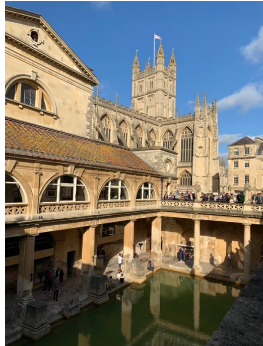
巨石陣 & 巴斯羅馬浴場。