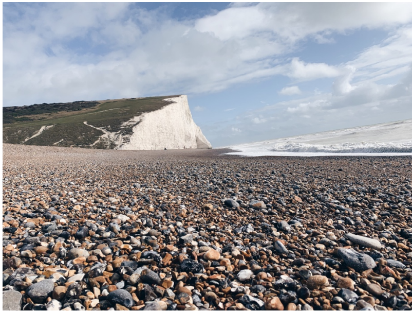
Seven Sisters Cliff. / National Park.

學校附近的知名景點，七姊妹斷崖是是一片純白色的白堊斷崖，從 Brighton & Hove 一路蔓延至 Eastbourne。若是從 Brighton 搭公車過來大約需要 40 分鐘的車程，一路向東，途中會經過二至三個小鎮、荒原以及大海。搭公車時所見沿路美景真的非常令人心曠神怡，我都會挑個晴朗無事的日子去那邊野餐！