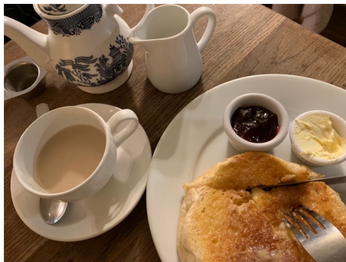
巴斯小鎮上的百年咖啡廳 Sally Luns。(超好吃！)