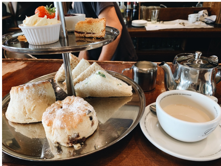
英國第一間咖啡廳 The Grand Café。(來英國就是要吃三層下午茶啊！)