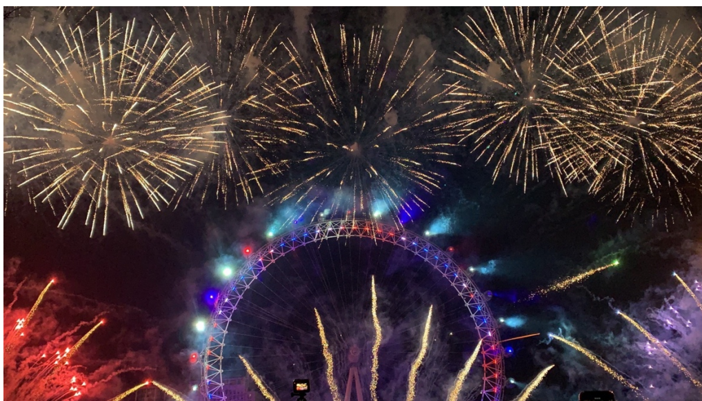
最後送上一張美麗的倫敦跨年煙火。