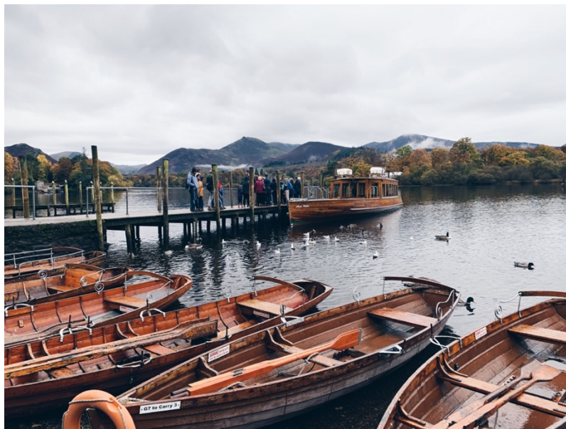
Derwent Lake. / 湖區 B&B 的早餐。

湖區是我此次造訪英國最喜歡的地方，可以待個三至四天，搭公車玩跳鎮行程，我這次玩 Windermere-Grasmere-Ambleside-Keswick-Bowness on Windermere(一日公車票約£11.5 鎊)，然後一定要住在當地的 B&B，體驗跟可愛的英國老奶奶一起生活的時光。