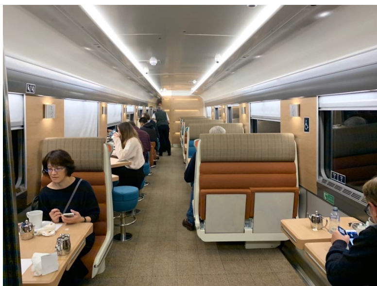
往返倫敦與愛丁堡的 Caledonian Sleeper 臥鋪列車(餐車部分)。