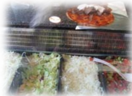
可以選擇的內餡料