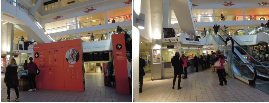
圖一、Busstasjon 一樓 Skyss 櫃台(右) 圖二、Busstasjon 一樓 Skyss 櫃台(左)