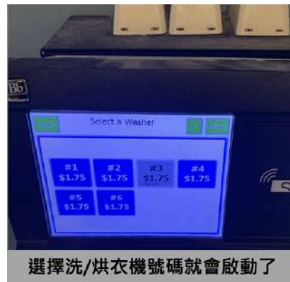
選擇洗/烘衣機號碼就會啟動了