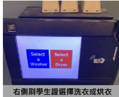
右側刷學生證選擇洗衣或烘衣