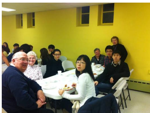
▲ISS 辦公室和 University Lutheran Church 合辦的活動

在 ISS 辦公室沒有舉辦活動的星期五晚上，我會到另一間離校園比較近的教會——University Lutheran Church 參加讀經團契，這間教會也是和 ISS 合辦過活動的教會，在團契開始前，大家會先在教會地下室一起吃晚餐，而因為這間教會比較屬於為學生設立的，牧師和其他教會成員在和大家聊天或讀經時，會解釋一些英文單字的意思，對國際學生學習英文幫助很大。