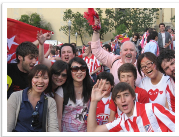
西班牙決賽：賽維亞 V.S.馬德里

作為一位稱職的交換學生，一定要適時體驗當地生活，除了課堂學習外，還要嘗試德國引以為豪的啤酒文化(不同地區有不同種啤酒)、吃豬腳、參加 PARTY，一定也少不了觀看足球賽，不但有國家內職業隊的比賽、歐洲盃足球賽、還有世界盃足球賽，就算沒有支持的球隊，還是可以去感受一下歐洲人熱愛足球運動的氛圍，相當有趣、瘋狂。GO GERMANY!!!