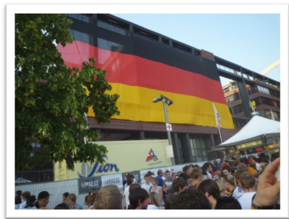
世足賽分組預賽：德國 V.S.迦納