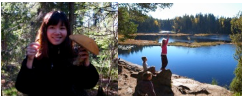
圖左：驚！左邊是市場的可食香菇，右邊據說也是可食的，但這也太大了吧！

芬蘭的自然景色豐富，俯拾即是，且國內也有五座國家公園，其中一個就在離赫爾辛基不遠的 Espoo，搭乘火車再轉公車即可到達，形成約需一到兩個小時。芬蘭人相當喜歡爬山，不管是夏天或是冬天，他們都會穿戴完整的登山裝備，和朋友相約一起健行。Nuksio 有三條登山路線，分為紅、黃、藍，每條路線會在路邊的樹上進行色牌的標示，相當容易辨認，也不太會迷路，可以依照自己體力的負荷程度行走，當然也可以像我一樣，只想悠閒逛逛、採香菇。芬蘭的七八月為莓果盛產期，路邊到處都是各種莓果，可供採收，而九、十月就是菇類的產期了，在入口處有標示清楚的牌子，告訴你哪種香菇可採、哪種有毒，不過由於菇的種類太多，外行人如我們只能採在市場看過、一定可食的香菇。Nuksio 裡面相當漂亮，好山好水，還設有烤肉爐讓大家在湖邊邊欣賞風景邊享用烤肉。