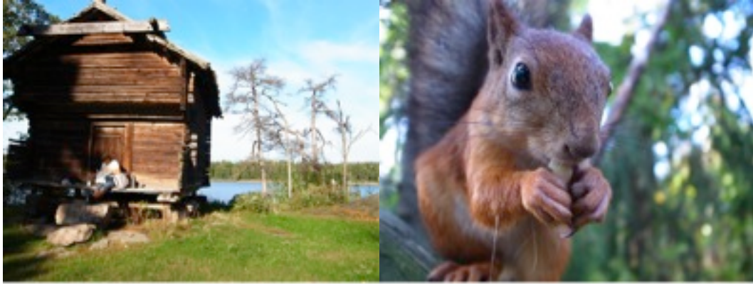
圖左：島上的房屋，逛累的人也會坐在上面休息。