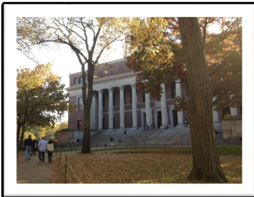
秋天的 Harvard 非常適合賞楓