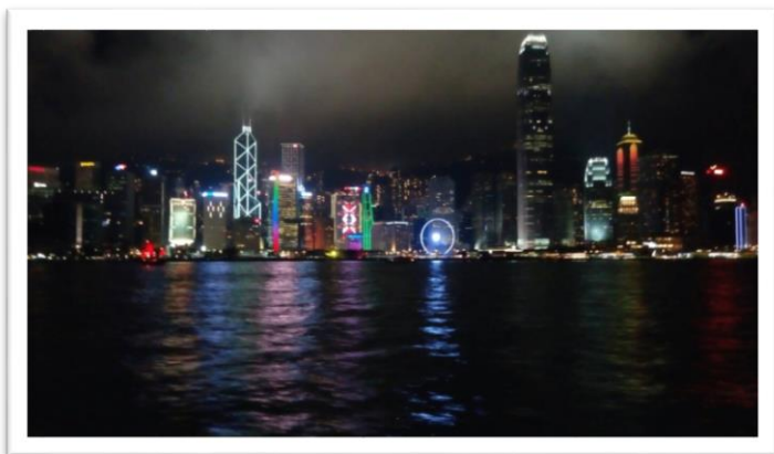
圖上：維多利亞港夜景

除了剛開學參與學校舉辦的旅行外，香港周遭也有許多小島值得一遊，比如長州、南丫島便是許多香港人假日也喜歡出遊踏青的地方，而香港本島的維多利亞港也總令人覺得看不膩，不論何時都有其迷人之處。