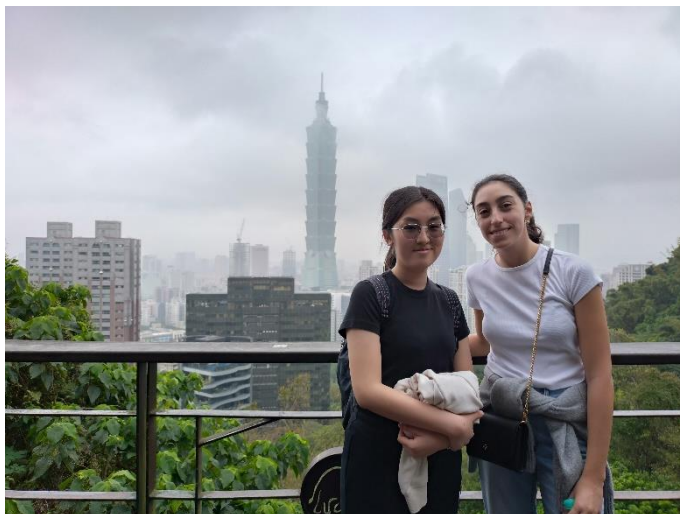
2024/03/18 爬到象山觀景台 後能看到 101 大樓