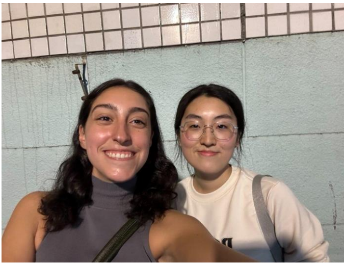
2024/02/20 第一次一起吃飯 後在學校附近留下的合照