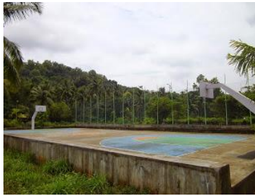
(進入校門的右手邊是足球場跟板球場, 遠方可以看到籃球場跟排球場)

進入校區後, 警衛應該會跟司機說明要怎麼走, 這時候身上一定有大包小包的行李, 如果司機走到了教學區, 如下圖, 請他換另一條路走。