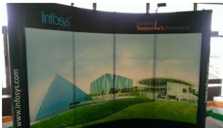
(Infosys 是印度知名的 IT 公司)