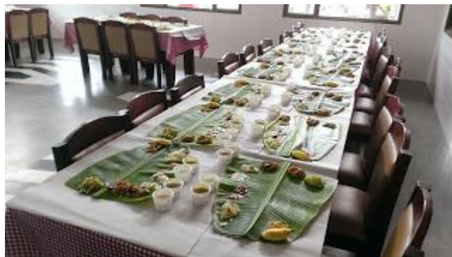
(午餐是喀拉拉特色風味餐)

迎新下午的活動是參觀圖書館樓上的博物館，這個是印度唯一的商業博物館，專門陳列及說明印度目前的商業發展。從早期鄭和下西洋之前就開始，一直到最新的科技與商業發展。只有這天會有專人協助解說，對於了解印度的企業發展是非常方便的。