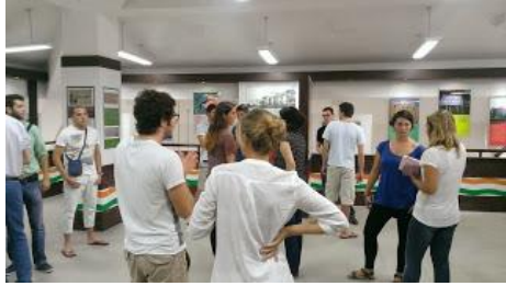
(這區是印度貨幣制度的變遷，超多種的)