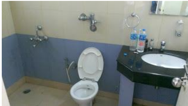
(廁所~熱水要另外付費)