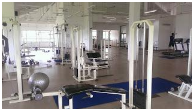
(J Hostel 旁的一樓是學生餐廳，三樓是健身房)