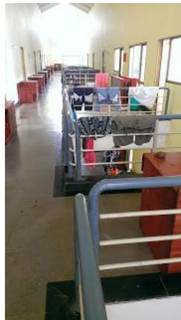
(走廊+曬衣場，旁邊還有洗衣機)