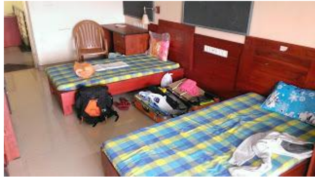
(雙人房~有兩組吊扇，冷氣另外付費)