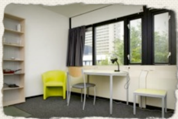
F-BUILDING，地理位置佳，設備齊全。