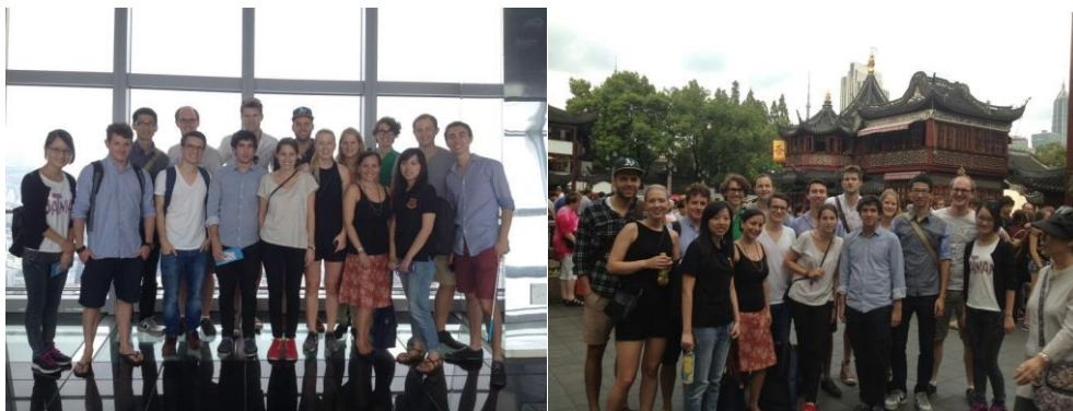
<國際交換生的上海一日遊>

起初的想法是到這裡找實習機會，不僅賺得一個履歷也認識這裡的就業市場。同時由於高金教學對象是以上班族為主，授課時間不是平常日晚上就是周末，對於找實習來說相當方便可以同時兼顧。高級金融學院是由上海市政府與交通大學合作辦學的項目，旨在上海逐漸成為亞洲金融重心的同時培育更多全球化金融人才，因此這個學院擁有非常多資源不論是資料庫的種類、討論室、電腦硬體、24H 可自由進出的 Financial lab 等等。另外雖然這間學院開辦不久，但根據當地人的理解其對上海金融市場的影響力已數一數二。