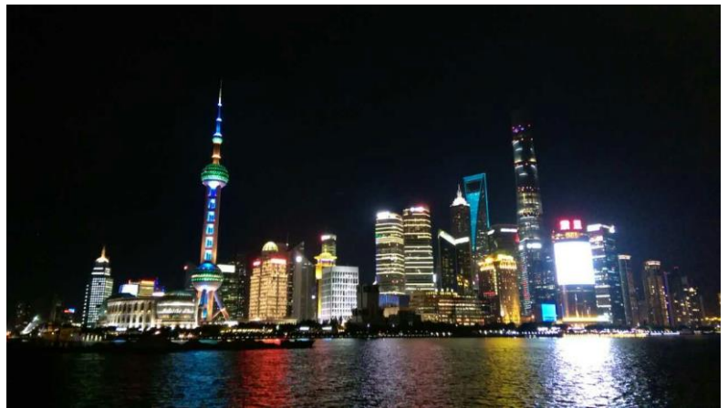
<外灘與陸家嘴金融區>

起初的想法是到這裡找實習機會，不僅賺得一個履歷也認識這裡的就業市場。同時由於高金教學對象是以上班族為主，授課時間不是平常日晚上就是周末，對於找實習來說相當方便可以同時兼顧。高級金融學院是由上海市政府與交通大學合作辦學的項目，旨在上海逐漸成為亞洲金融重心的同時培育更多全球化金融人才，因此這個學院擁有非常多資源不論是資料庫的種類、討論室、電腦硬體、24H 可自由進出的 Financial lab 等等。另外雖然這間學院開辦不久，但根據當地人的理解其對上海金融市場的影響力已數一數二。