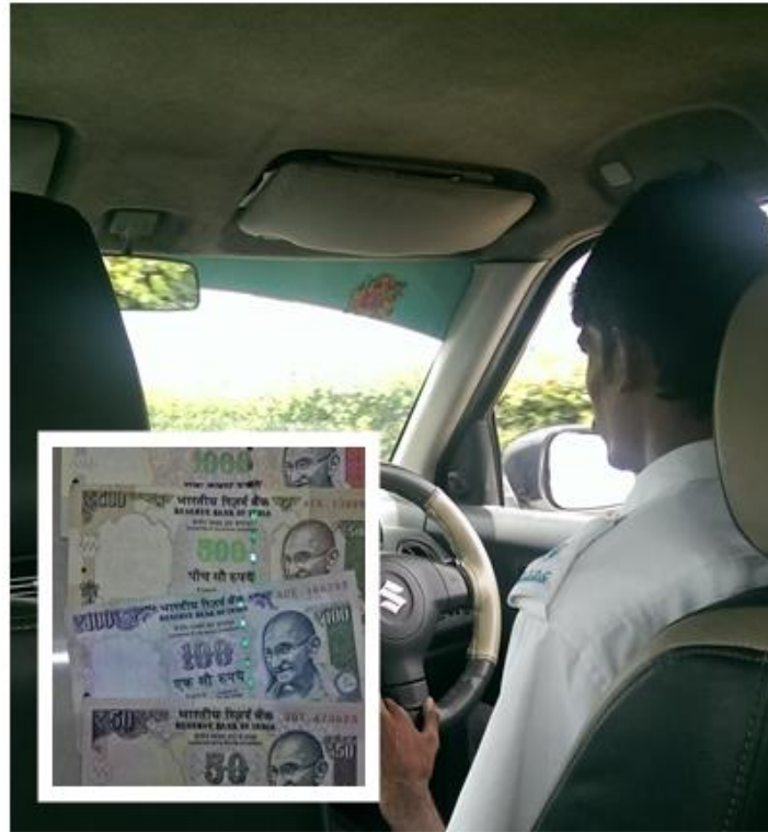
機場計程車與印度盧比

班加羅爾機場外頭有政府規劃的機場計程車搭乘處，不知道是不是因為政府有大力整頓的關係，所以機場計程車司機有乖乖跳錶，沒有對我們漫天喊價。通常司機願意乖乖跳錶這一點真是非常難得，因為在印度搭車時，只要司機看到外國人招手，通常都是漫天開價，而且往往他們喊出來的價錢都是實際跳錶費用的2到5倍。