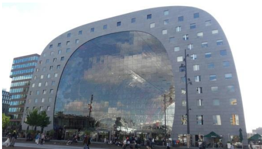
▲ Markthal 位於Blaak Station

處理完80%待在荷蘭所需要的證件，接下來一定要來認識一下平常的買菜好去處啦!! 相信大家出發之前，一定都有Google過鹿特丹這個華麗的菜市場，除了富有現代感的外觀，內部的天花板和商家更是夢幻。B1有荷蘭的國民超市 Albert Heijn 及美妝藥品店Etos，一樓則設有大型亞洲超市—華南行和五花八門的攤販，從生鮮、醃漬肉品、辛香料到荷蘭傳統煎餅和小鬆餅，應有盡有。