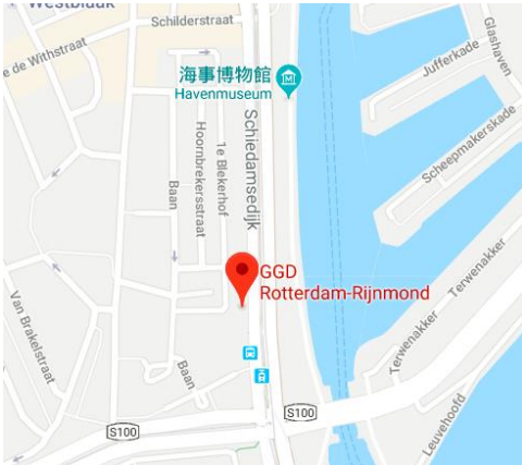
▲GGD位於鹿特丹海事博物館附近

荷蘭辦事處在寄回MVV的文件中，有兩張跟TB-test相關的文件(長得跟你回寄給學校的一模一樣)，不要懷疑!請再簽一次同意書帶去荷蘭，檢查報到時會跟你要這兩份文件。另外，以下幾點也請注意：