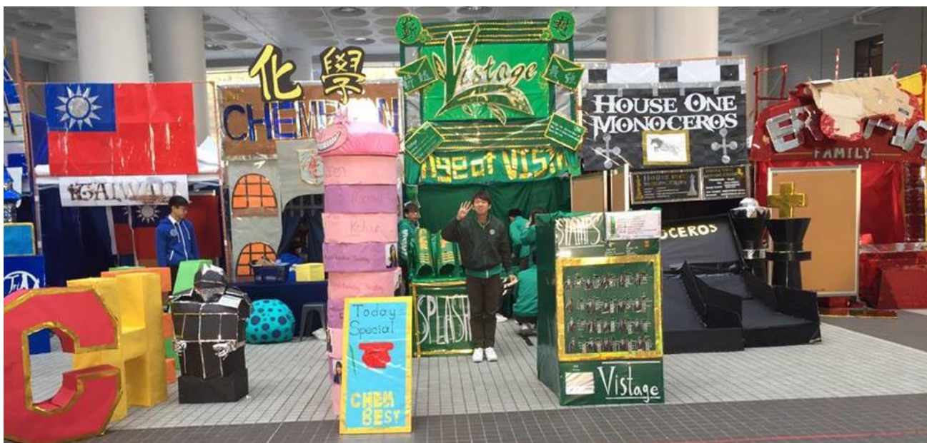
圖三、Promotion Period 攤位布置

為了吸引目光，各攤會都會用盡自己的方式發揮。除了極有特色的攤位布置(如圖)，有些攤位聚辦每日活動，有些提供免費小點心、獎品，有些還有抽獎活動。他們的獎品超級多元化，不只有基本的資料夾與筆記紙，還有手機殼、化妝品、耳機、甚至有超大一公尺抱枕和電磁爐。每個攤位都一定會有遊戲。他們自己手工製作手足球、套圈、投籃機、彈珠台等各式遊戲與人們互動，增加情感。最常見的就是推銷自己的未來團隊，名字與臉對對看。我目前玩過最獵奇的對對看是他們把候選人的臉PS掉，我們要把正確的五官跟臉對在一起。