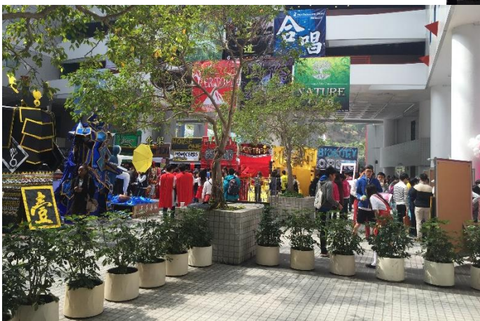
圖一、Promotion Period 會場