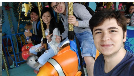
圖 5. 海洋公園。