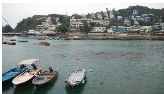
圖 4. 南丫島。

假日時，我則會安排行程搭船到離島觀光。比方度假風情濃厚的南丫島，以及觀光勝地長洲島等。有著刺激冒險的雲霄飛車的海洋公園，即使用上一整天的時間，也無法玩遍所有的設施。