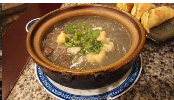
圖 7. 中國南京，南京大牌檔，鴨血粉絲湯。

前往中國旅遊對我而言是非常珍貴而難忘的經驗。曾經跟服膺共產思想的大陸人爭辯兩岸議題。也曾經在搭計程車途中，聽著司機訴說他離鄉背景工作的辛苦，語氣中帶著當年沒能隨國民黨到臺灣的遺憾。值得一提的是，在廣州旅遊時，