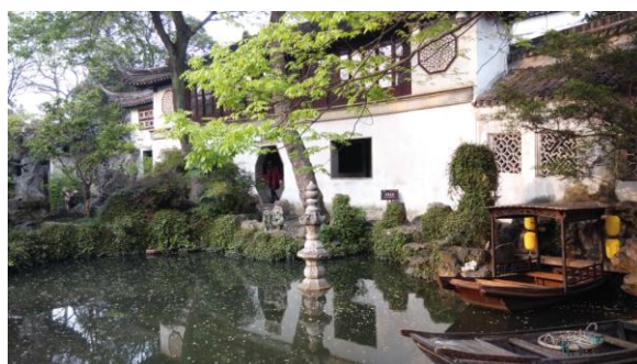
圖 6. 中國蘇州，留園。