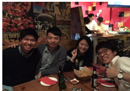
圖 3. 尖沙嘴，Tequila Jack's 墨西哥餐廳。