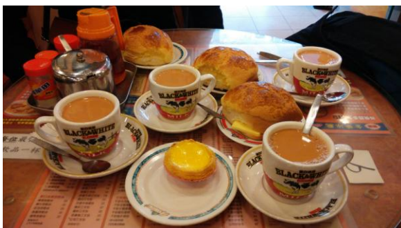
圖 2. 旺角，金華冰廳波蘿油、港式蛋塔、熱奶茶。

而我平時最常吃喝玩樂的地方則是旺角一帶，包含好吃的金華冰廳的波蘿油和絲滑奶茶 ( 號稱像絲一樣滑順入口 )。旺角一帶可以看見最道地的香港文化，老香港尚未完全褪去的歷史面貌也能一窺究竟。