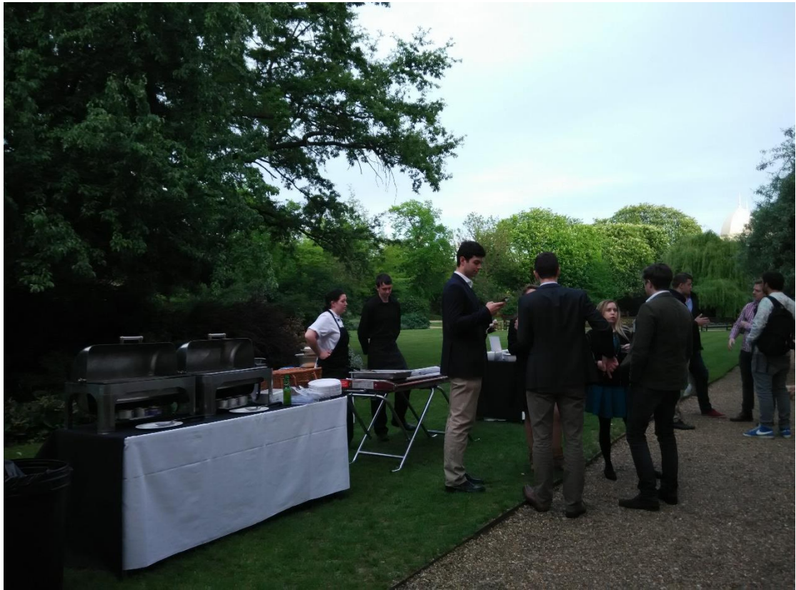
(圖三) London Stock Exchange