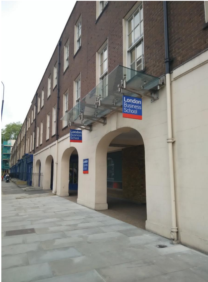
(圖一) LBS 校園