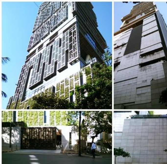
這是印度首富的住宅，裡面的設備超乎一般人的想像，連直升機停機坪都有(Mumbai)