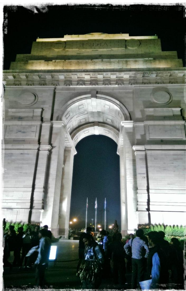
India Gate (New Dehli)