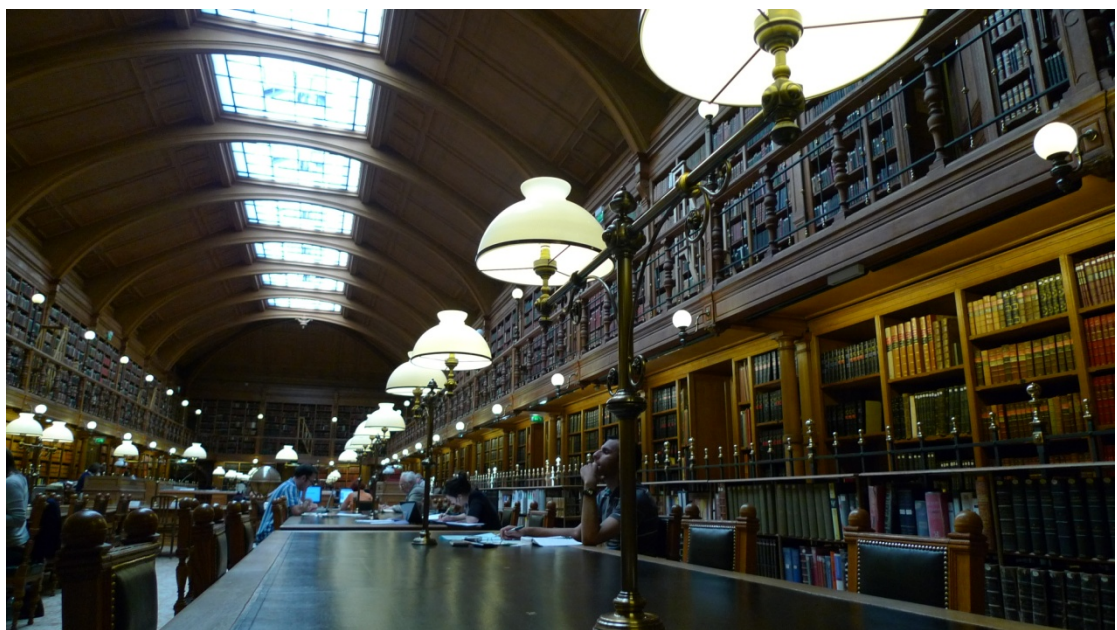
市政廳圖書館內部