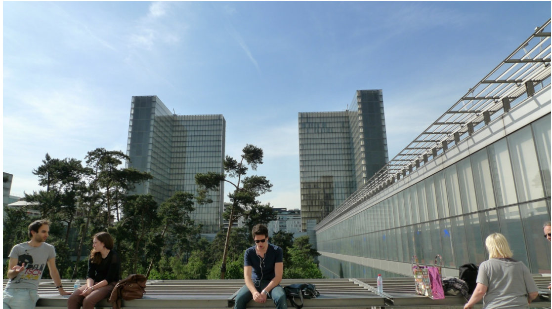
密特朗圖書館外觀