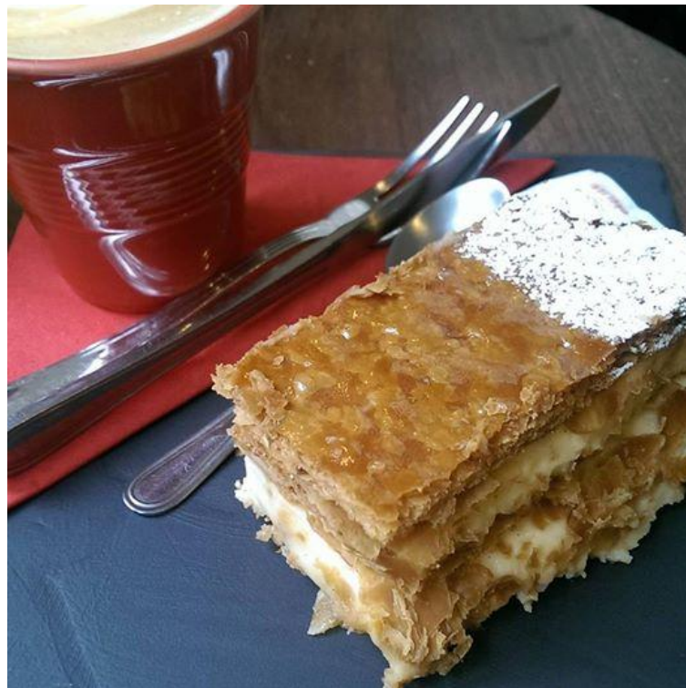
A Table 的奶油蛋糕 ( Astoria 站附近的小店 )

匈牙利當地食物多偏重鹹，得像我這種重口味愛好者才較能適應，而最著名的料理當然就是牛肉湯 Goulash 了！每間餐廳的做法不盡相同，有些牛肉味不明顯，有些則莫名地有台灣味，價格從 600Ft 到 1600Ft 皆有。我目前吃過最好吃的是在 Astoria 站附近的 Kazimir，料豐富、牛肉味又濃厚，雖然價格偏高但絕對值得試試！另外來自土耳其的 Kebab 也是常見的小吃之一，約莫台幣 100 元以內。