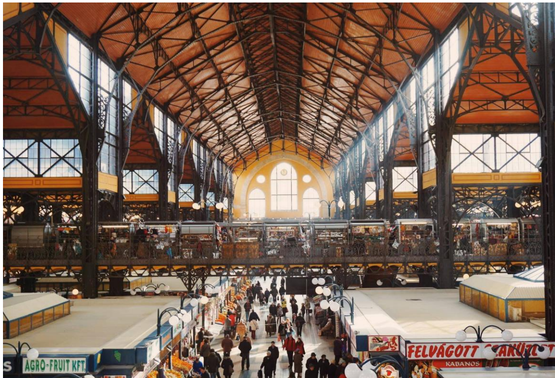
學校旁的中央市場

Corvinus 是匈牙利頂尖的大學之一，坐落於多瑙河畔的自由橋旁，鄰近最新的 M4 地鐵線，公車、電車亦可抵達，學校旁還有著名的中央市場，而學校的 main building 更是被聯合國教科文組織列為遺產，在古蹟裡上課可說是別有一番風味，但大部分商學院學生的課都在新穎的 C Building。