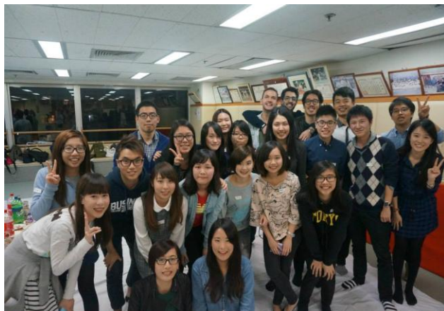
↑圖 7. 因為 Kengo，而認識的其他也來自城大的交換生。