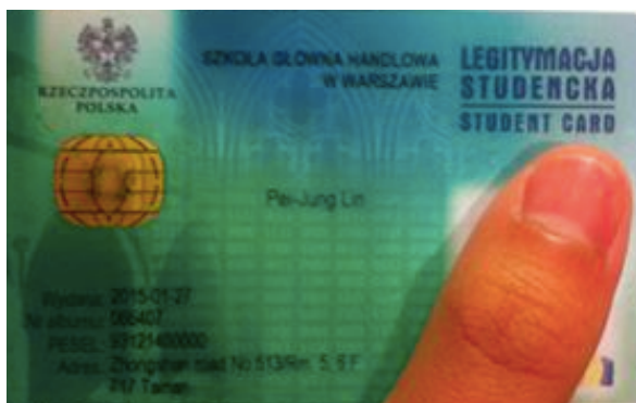
華沙經濟大學學生證

這張學生證非常非常的重要，如果要在波蘭境內旅遊，拿著這張學生證可以讓你擁有五折的票價優惠，此外他也是一張交通卡，拿到他以後你可以到離學校最近的 Pole Mokotowskie 站儲值三個月交通卡，做完這個動作以後，只要擁有這張神奇小卡片，舉凡華沙的捷運、電車、公車都不用再付車票錢了。