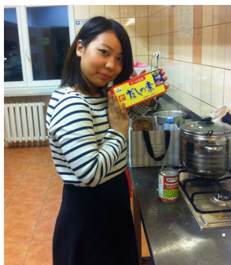
宿舍廚房(我的日本室友)