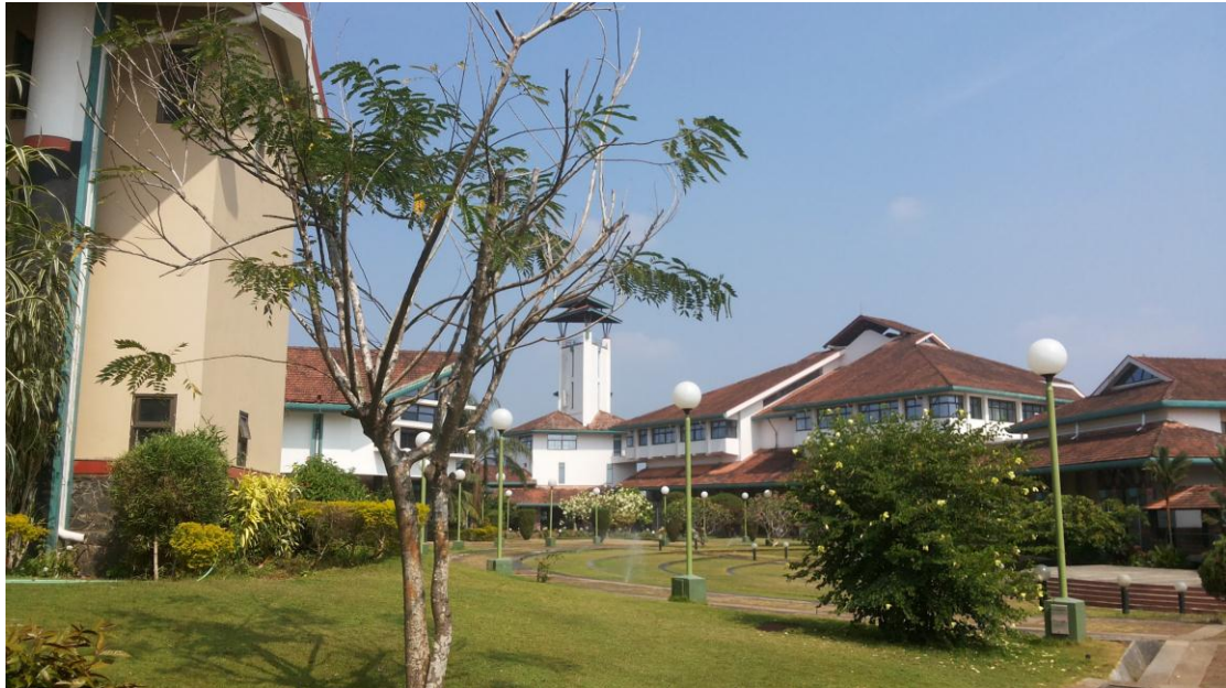
校園風光一撇（其實學校很漂亮哦！）